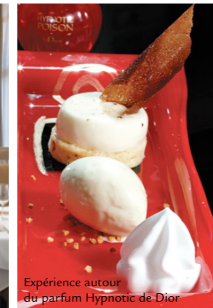
Expérience autour du parfum Hypnotic de Dior