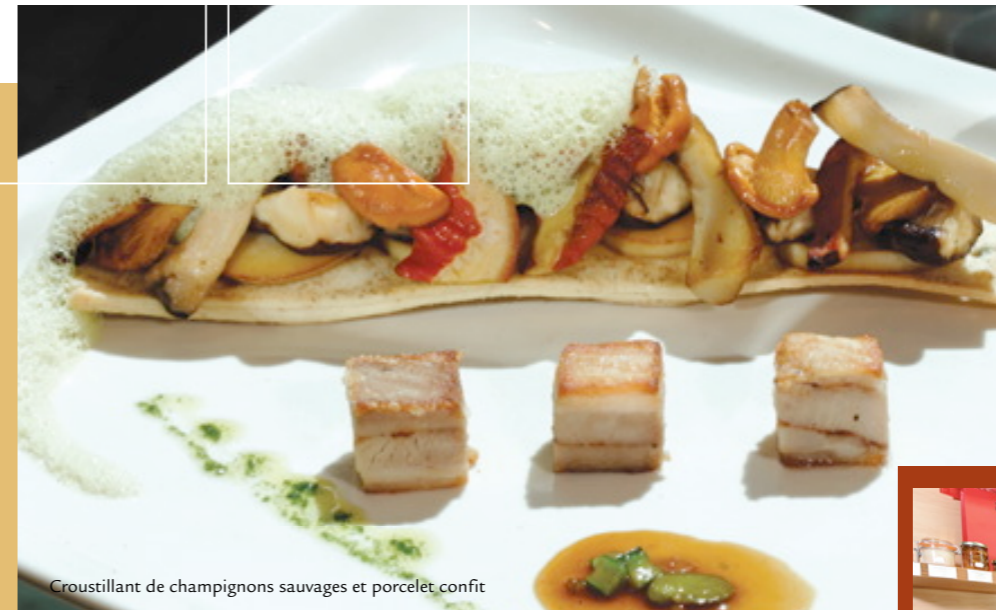
Croustillant de champignons sauvages et porcelet confit